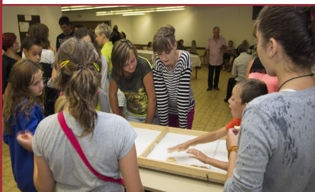
Un jeu en bois (simple, mais efficace) a su occuper les plus jeunes

Plus tard dans la soirée, ce n'est pas une énorme averse qui a pu décourager les 250 personnes, réunies au foyer communal et sous les chapiteaux installés pour ce moment convivial.