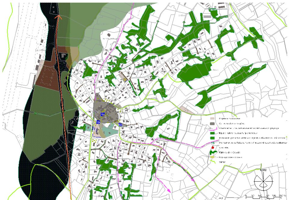
Une des cartes des enjeux, issue du diagnostic, on y souligne l'impact du cadre boisé autour et à l'intérieur du village

Une fois que le projet urbain sera ainsi défini l'étape suivante sera celle de la traduction sous forme de zonage et de règlement.